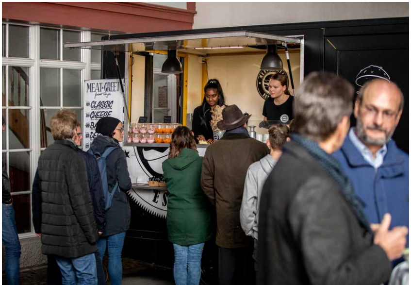
Der Burger-Truck darf auch bei der Finissage nicht fehlen.

Neben allen Highlights und Spezialitäten in diesem ganz besonderen Jahr wurden 365 Alltags-Tage gemeistert – ein Engagement der Mitarbeitenden, das uns mit Stolz erfüllt.