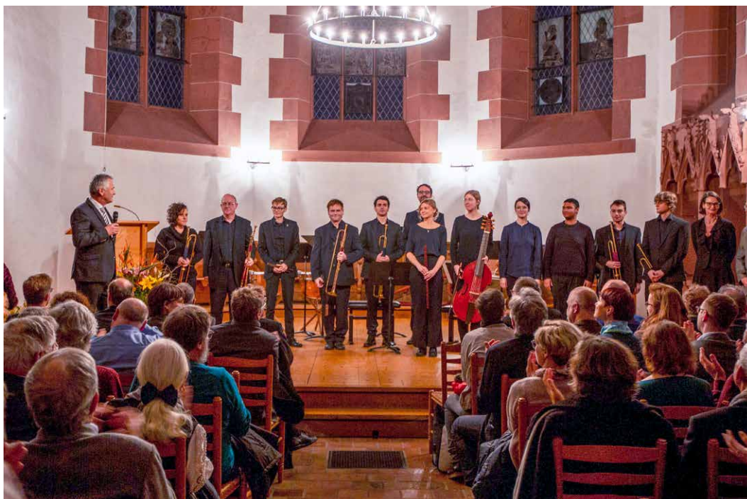
Feierliche Eröffnung des Jubiläumsjahres mit Musikerinnen und Musikern der Schola Cantorum Basiliensis

Das Jahresergebnis (CHF 619'369) ergibt sich aus dem Ertrag abzüglich des Aufwands.