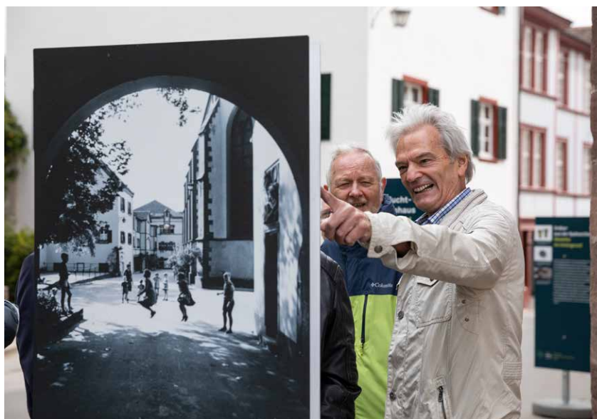
Am Tag der Ehemaligen werden alte Erinnerungen aufgefrischt.

Das Jubiläum hat Gelegenheit geboten, auf die lange Geschichte der Institution zurückzublicken – aber auch der Blick in die Zukunft der stationären Kinder- und Jugendhilfe wurde in das Jubiläumsprogramm aufgenommen. Es wurde der Frage nachgegangen, ob Heime wie das Bürgerliche Waisenhaus in zwanzig Jahren noch existieren werden und wie ihr Angebot dann aussehen müsste. Auch wenn die Fachtagung darauf keine endgültige Antwort geben konnte, so wurde doch deutlich, dass Lösungen nur in gemeinsamen Anstrengungen von Theorie und Praxis und in einer Intensivierung der Kooperationen ambulanter und stationärer Massnahmen erarbeitet werden können. Das Bürgerliche Waisenhaus wird sich auf die notwendigen Diskussionen einlassen und dazu weitere Fachtagungen durchführen.