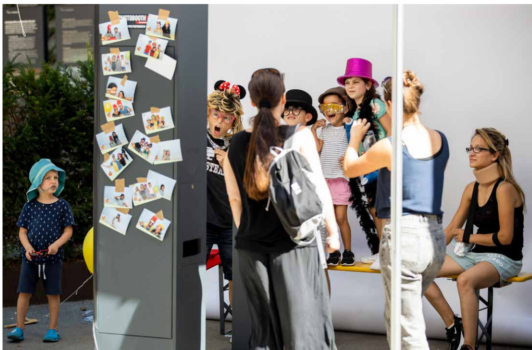
Am Jubiläumsfest am 25. August kommen v.a. die Kinder auf ihre Rechnung – aber nicht nur!