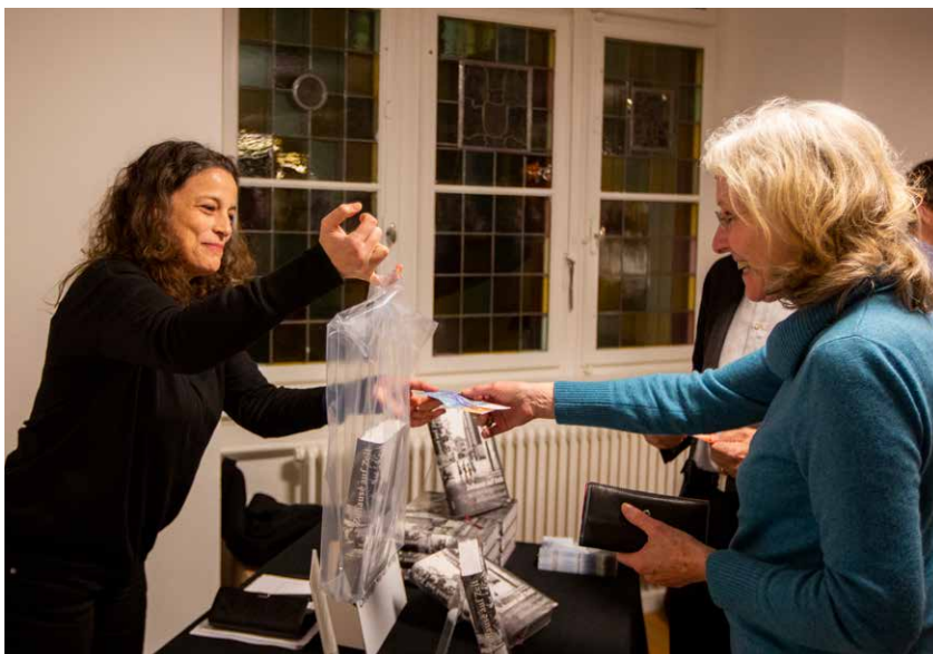
Das Jubiläumsbuch «Zuhause auf Zeit» findet an der Buchvernissage grossen Absatz.

Gemäss dem Leistungsauftrag wird eine allfällige Unterdeckung des Angebotes Arbeitstraining/Time-out (ATT) über den Immobilienerfolg ausgeglichen. Aus diesem Grund wurden 2018 dafür CHF 54'846 eingesetzt. Da im 2019 eine Überdeckung des Angebotes Arbeitstraining/Time-out (ATT) vorhanden war, musste kein Ausgleich über den Immobilienerfolg vorgenommen werden.