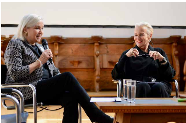
Engagierte Podiumsdiskussion an der Fachtagung «Fremdbetreuung – Ja! Aber...»

Der Wechsel der Teamleiterin hat einen Prozess zur Klärung der Rollen, Funktionen und Verantwortungen im Team angestossen.