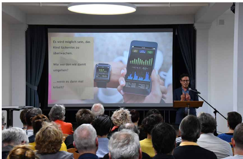
Die gut besuchte Fachtagung «Heimerziehung neu denken» wagt den Blick in die Zukunft.

Bilanzstichtag ist jeweils der 31. Dezember. Nachfolgend werden die Grundsätze kurz dargestellt.