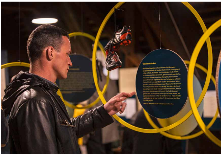
Die Ausstellung «nicht daheim daheim» vermittelt spannende Einblicke ins Heim.

Nach dem Auszug der Minerva-Primarstufe konnte mit dem Erziehungsdepartement ein neuer Mieter gefunden werden. Nach der Renovation und kleineren Umbauten werden drei Kindergärten-Spezialangebote in die Räume im Südostflügel einziehen. Das Bürgerliche Waisenhaus erhofft sich mittelfristig neue Möglichkeiten von kombinierten Wohn- und Bildungsangeboten durch die Nähe der Angebote.